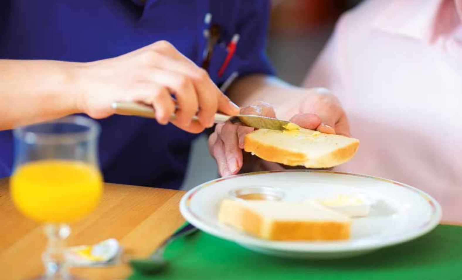
Helfende Hände sind willkommen

Palliative Care ist eine komplexe Aufgabe in der Behandlung, Betreuung und Begleitung von alten, unheilbar kranken und sterbenden Menschen. Ressourcen wie Biografie, Fähigkeiten und Angehörigkeiten werden im Betreuungsalltag berücksichtigt, um die bestmögliche Lebensqualität bis zum Tod zu erhalten. Betreuungspersonen setzen sich mit ihrer eigenen Endlichkeit auseinander und erhalten, nebst persönlichem Gewinn wie Reife, Kompetenz und Lebenserfahrung, ein vertieftes Verständnis für Menschen in der letzten Lebensphase. Angehörige werden vom Betreuungsteam situationsbezogen beraten und gestützt. Das Betreuungspersonal ist mit den Grundwerten von Palliative Care vertraut und kann diese im Alltag mit der Bewohnerin, mit dem Bewohner leben.