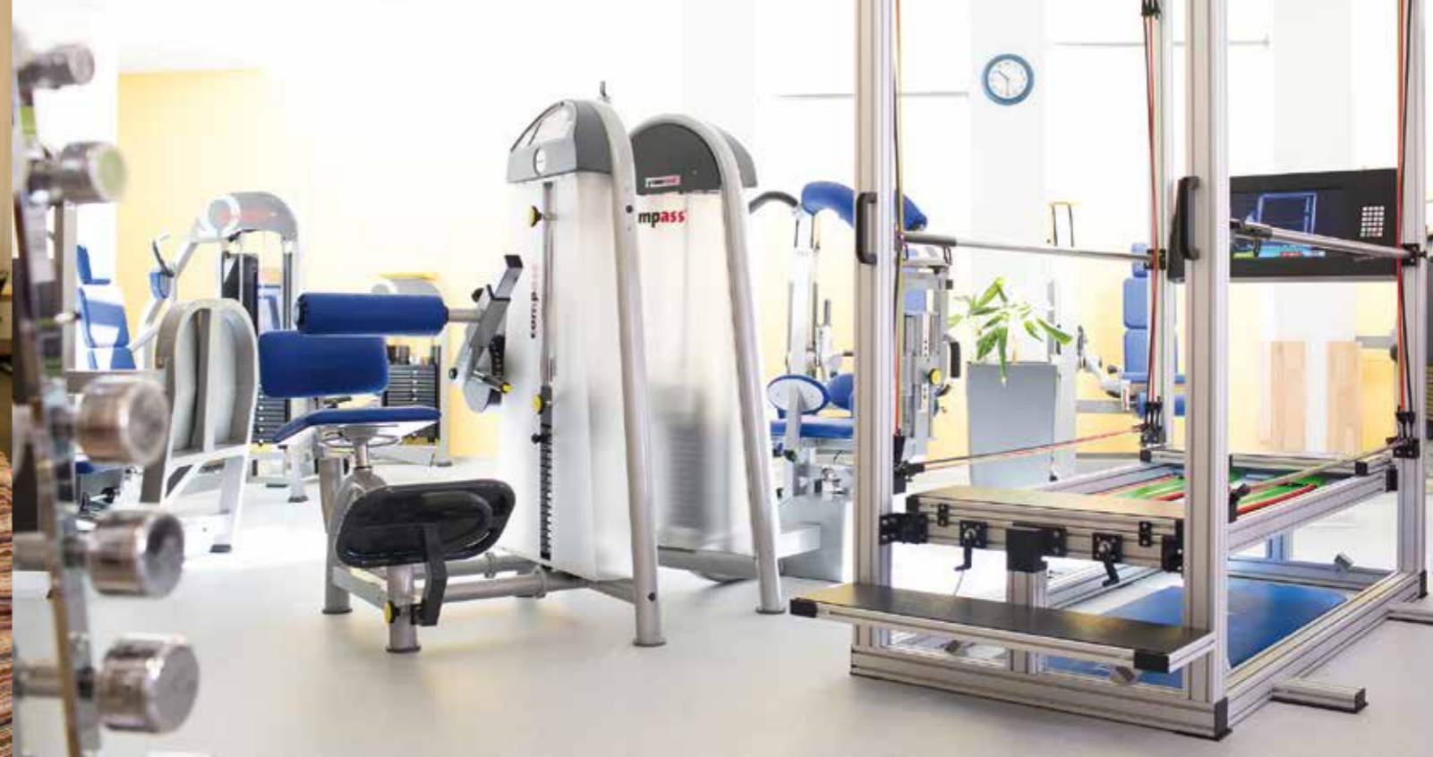
FITplus mit neusten Geräten wie z.B. Power Plate und SensoPro Trainer

Es ist ein grosses Glück auf Erden, mit frohem Herzen alt zu werden.