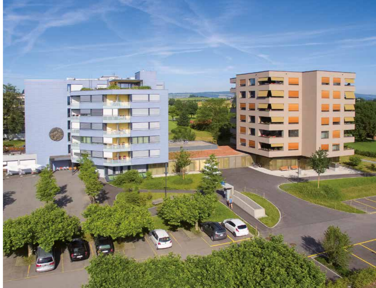
Tolle Lage des Alterszentrums und Alterswohnungen

Mein erster Dank gilt Ihnen, liebe Bewohnerinnen und Bewohner, Mieterinnen und Mieter, und allen Angehörigen. Sie haben im vergangenen Jahr der Arbeit der Stiftung Wohnen im Alter wieder viel Vertrauen geschenkt. Ein grosses Dankeschön